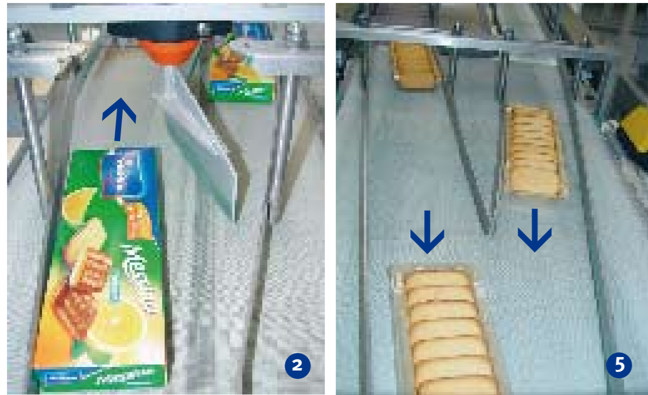
Die elektrische Weiche leitet die Produkte bei Bedarf automatisch in den HELIFLEX- Speicher