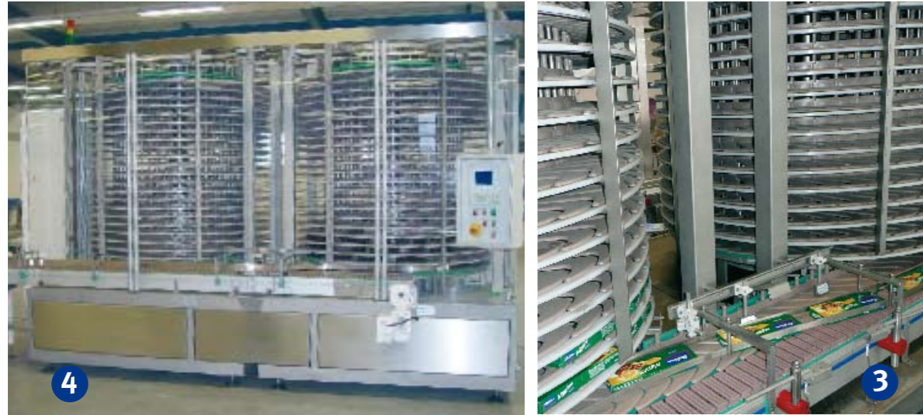
Der HELIFLEX-Speicher zeichnet sich durch die kompakte Bauweise selbst auf engem Raum aus